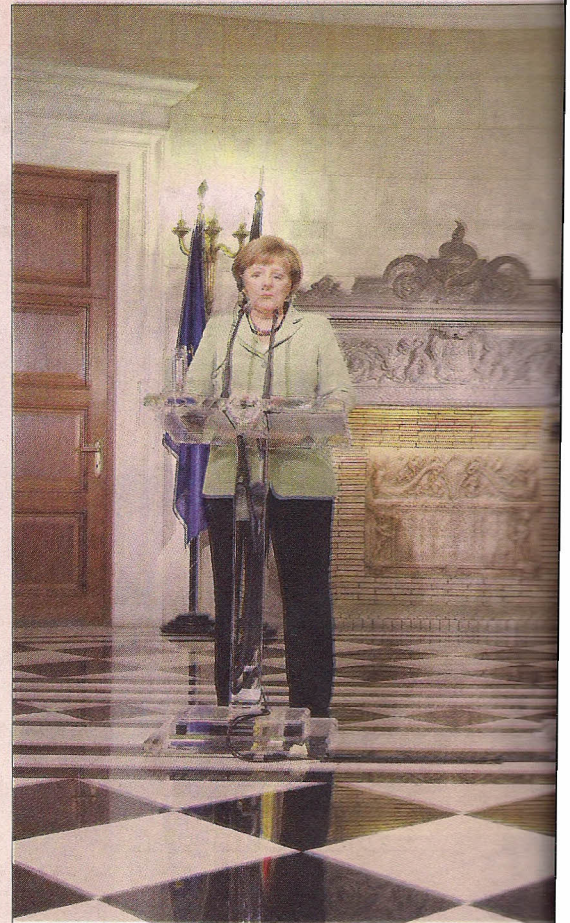
وزراء اليوناني أنطونيوس ساماراس خلال المؤتمر الصحفي في كسيموس في أثينا أمس

وشهدت أثينا أمس مظاهرات حاشدة، بتنظيم من النقابات واتحادات العمال والموظفين، وانتهت بصدامات ومواجهات مع الشرطة التي اعتقلت نحو 90 شخصاً، ورفض المحتجون التدابير التقشفية الجديدة التي تخفف من المرتبات والمعاشات، في ظل زيادة نسبة البطالة التي وصلت إلى أكثر من 50 في المائة في صفوف الشباب.